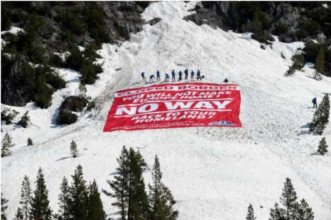
Des membres de Génération Identitaire lors de leur opération pour contrôler l'accès des migrants aux cols alpins, le 21 avril 2018 à Nevache, près de Briançon.

A l'époque des faits, le parquet avait eu des difficultés à appréhender les contours pénaux de l'opération de Génération Identitaire. Dans un contexte d'émoi politique et